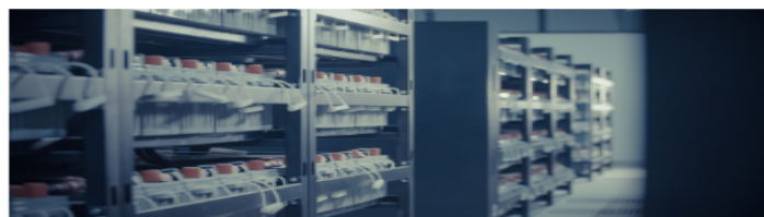
Sistema multidisciplinar avanzado de formación práctica a distancia.

Te puedes inscribir en los itinerarios formativos incluidos en el Catálogo de Especialidades Formativas del SEPE, Mantenimiento de Servicio de Centros de Procesos de Datos (CPD) y Mantenimiento de Infraestructuras de Centros de Procesos de Datos (CPD), si cumples los siguientes requisitos: